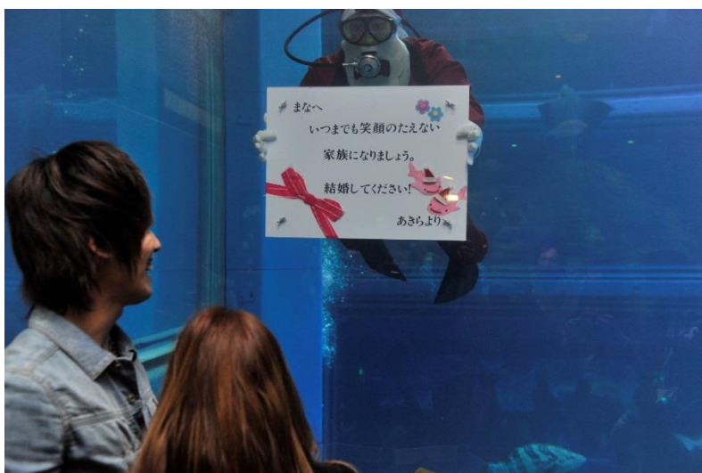
過去のアクアメッセージ参加者と、メッセージを送るダイバー

大阪市港区の海遊館では、ダイバーがサプライズ・メッセージを届ける『アクアメッセージ』を実施してきましたが、好評につき、愛があふれるバレンタイン&ホワイトデーの期間、毎日限定1組様のサプライズを承ります。実施期間は平成28年2月13日（土）～3月14日（月）で、応募締切は実施希望日の2週間前までです。また、平成28年2月13日（土）～2月28日（日）の土・日、「夜の海遊館」を紹介し、夜の水槽にそっと足を踏み入れられる特別なプレミアムバックヤードツアーを開催します。