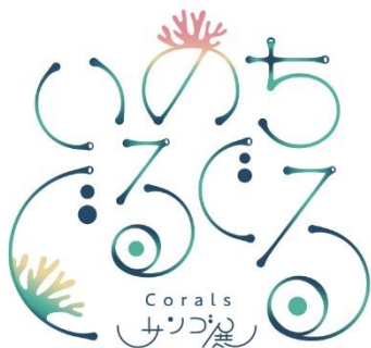
①『いのちぐるぐるサンゴ展』

海遊館（大阪市港区）は、現在リニューアル工事を進めている「グレート・バリア・リーフ」水槽のオープン（2024年9月予定）に先駆け、 2024年3月5日（火）より、2つの展示を開催します （2024年2月1日報道発表済み）。開催を前に、両展示の開催概要詳細を発表します。