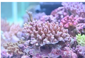
ウスエダミドリイシ