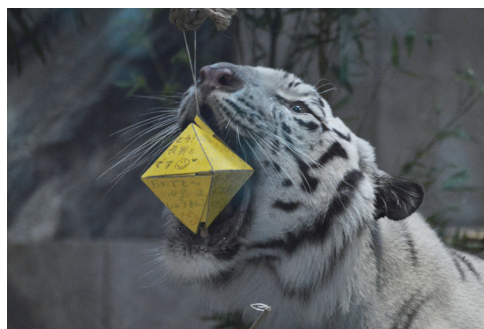
お祝いメッセージをアクアに届けよう! (写真は過去のイベントのもの)