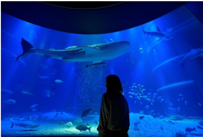
「おひとりさま編」の様子

大阪市港区の海遊館では、2022年2月14日（月）から2月27日（日）まで、完全予約の少人数制イベント「閉館後の海遊館 ～心を満たす、静寂の海～」を開催します。照明が暗くなり、BGMも止まった閉館後の館内は静かな落ち着いた空間となっており、ゆったりとした時間をお過ごしいただけます。