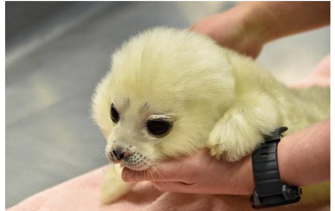
ワモンアザラシ「ミゾレ」 (2021年4月5日撮影)