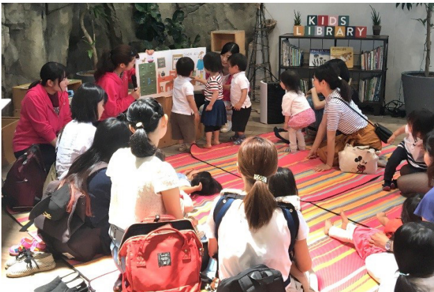
過去の読み聞かせの様子

大阪府吹田市「EXPOCITY」の生きているミュージアム「NIFREL（ニフレル）」では、梅花女子大学（大阪府茨木市 学長 長澤修一）と共催で、「生きものの絵本の読み聞かせ」を開催します。開催日は2019年6月29日（土）で、時間は11:00からと14:00からの1日2回、各回30分で参加費は無料です（ニフレル入館料のみ必要）。事前のお申し込みは必要なく、当日ご来館いただいた親子ならどなたでもご参加いただけます。