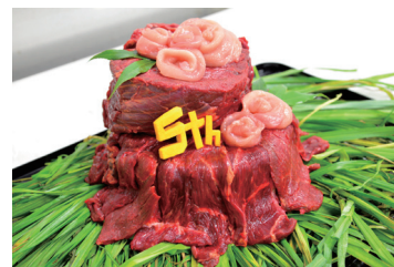
写真は昨年プレゼントしたお肉ケーキ