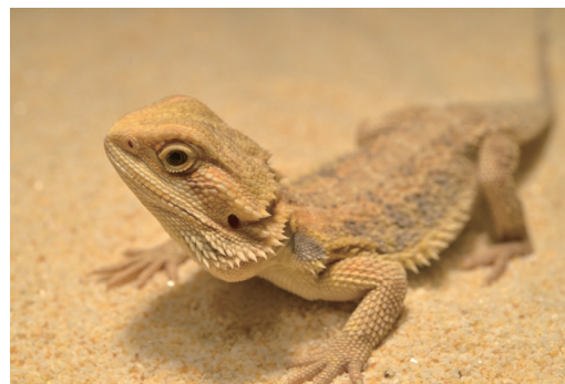
フトアゴヒゲトカゲは、森林や草原、岩のある砂漠地帯など、さまざまな環境に適応し生息しています。砂漠に生息するものは、体を砂と同じ色に変化させ、天敵に見つかりにくくなっています。