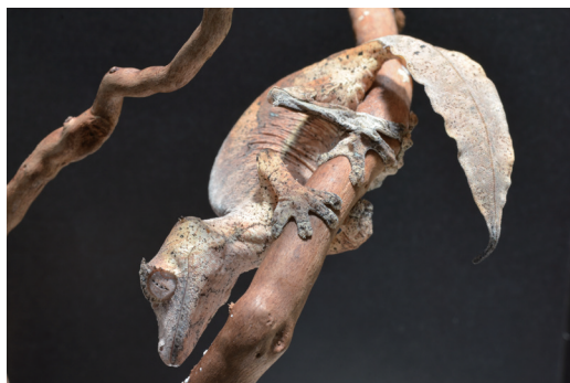
枯れた葉のような体をしたエダハヘラオヤモリ。特に尾は木の葉にそっくりです。