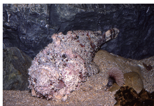
全身にゴツゴツとしたコブ状の突起があり、海底の岩にそっくりに擬態し、その姿を見分けるのは大変難しいです。