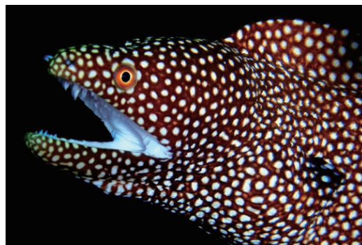
シモフリタナバタウオ(写真左)は、全身の白い斑点と、背ビレの後ろにある大きな目玉のような模様で、ハナビラウツボ(写真右)などの大型のウツボに擬態していると考えられています。