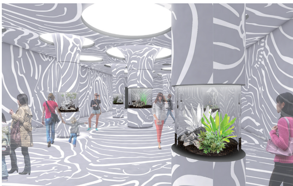
生きものの「かくれる」能力を空間全体で表現した「かくれるにふれる」(イメージ)

大阪府吹田市「EXPOCITY」の生きているミュージアム「NIFREL(ニフレル)」では、2019年3月1日(金)に、生きものが自然を生き抜くための多様な“かくれる術”をテーマとした、新たなゾーン「かくれるにふれる」をオープンします。自分の姿を生活環境や背景とそっくりに変化させ、獲物に気付かれないように近づいたり、あるいは敵から身を守るなど、「かくれる」を極めた個性的な生きものたち13種24点を展示します。さらに、ニフレルならではの空間演出により、展示室全体で生きものの「かくれる」能力を体感していただけます。