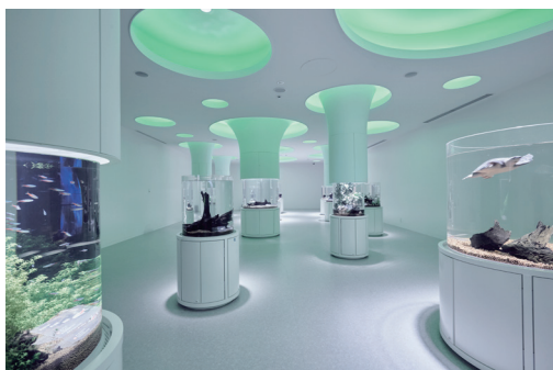
変更前の「みずべにふれる」ゾーン。 光の差し込む水辺の木立をイメージした空間デザイン。