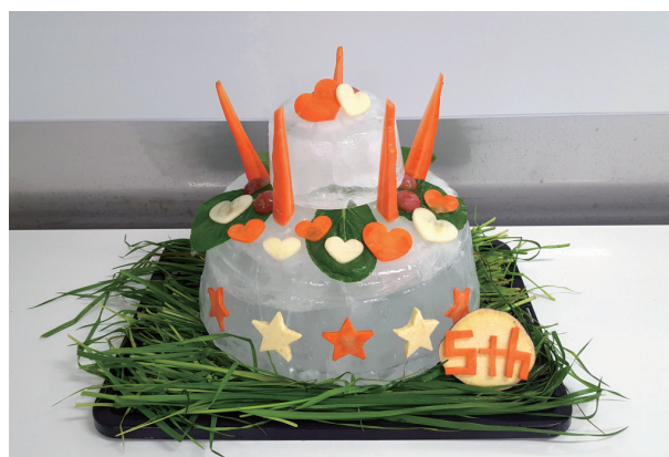
「野菜ケーキ」（イメージ）

今回は「モトモト」の5歳の誕生日を記念し、7月8日（日）10時15分に、色々な野菜をデコレーションした「野菜ケーキ」をプレゼントします。また「野菜の宝さがし」として、色々な野菜を穴を開けたボールに隠したり、プール内の様々な場所にデコレーションします。これらの食べ物を探す、選ぶといった「モトモト」の行動の多様性をキュレーターの解説とともにご覧いただけます。