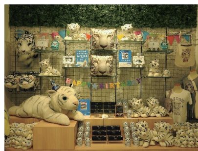
「アクア誕生日お祝いディスプレイ」イメージ