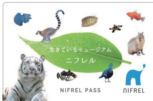
ニフレルパスデザイン

また、2017年度版ニフレルパスをお持ちの方が2018年度版に更新していただくと、パスポートの色が変わるほか、「オリジナルパスケース」のプレゼントや、閉館後のニフレルを探検気分で見学する「ナイトニフレル」へのご招待など、さらにお得な特典をご用意しています。