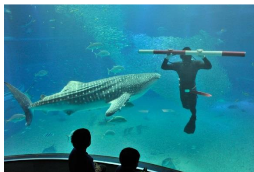
基準尺を持つダイバー（過去の様子）

海遊館では、計量記念日を通して生き物たちが元気に成長する様子を紹介し、自然環境について興味をもってもらえればと考えています。