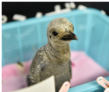
10 月 18 日の様子