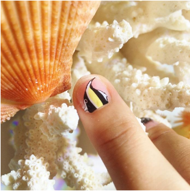
▲イベントで体験出来る「ツノダシネイル」