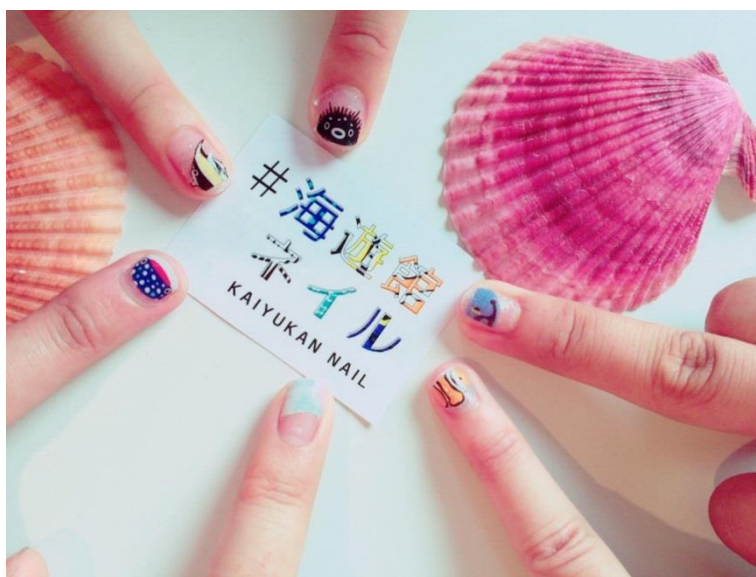
#海遊館ネイル イメージ

大阪市港区の海遊館は、平成 28 年 7 月 28 日～8 月 25 日までの毎週木曜日（※8 月 11 日を除く）に、生き物をモチーフにしたネイルを楽しむイベント「#（ハッシュタグ）海遊館ネイル」を開催します。当日参加型のイベントで、各日先着 90 名様限定で行います。参加費は、1 人 500 円でオリジナルネイルシール付き。海遊館館内 6 階特設スペース「夏ラボ海遊館」で開催します。