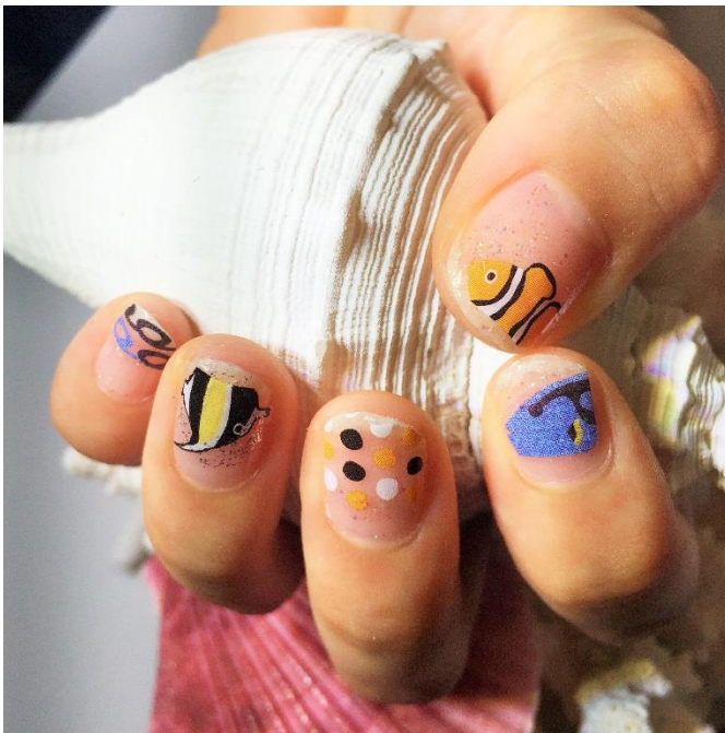
▲セルフネイルのイメージ