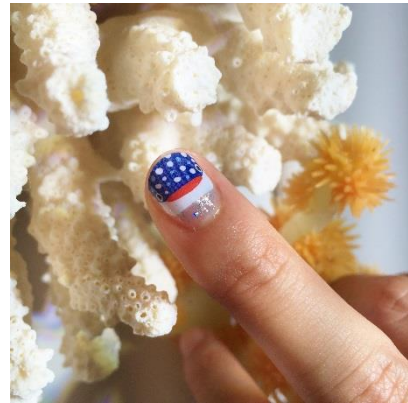
▲ (上) ハリセンボンネイル (下) ジンベエザメネイル