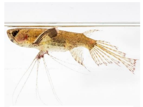
バタフライフィッシュ

<生体> バタフライフィッシュ ：蝶が羽を広げるように泳ぐ姿からこの名前がついた。浮袋を使って空気呼吸ができる。