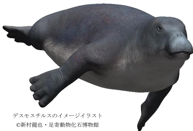
デスモスチルスのイメージイラスト ©新村龍也・足寄動物化石博物館

大阪市港区の海遊館は、平成 28 年 7 月 15 日（金）から平成 29 年春まで、企画展「デスモスチルスのいた地球 ～謎だらけの古代生物たち～」を海遊館エントランスビル 4 階にて開催します。本企画展のテーマは、「生き物たちの“謎だらけ”の進化」。デジタルアトラクションや生きた化石と呼ばれる生き物との出会いにより、“謎だらけ”の進化の不思議と面白さを体感できる企画展です。