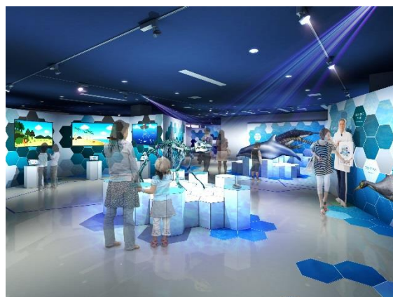
「デスモスチルスのいた地球」イメージ

企画展のタイトルにもなっている「デスモスチルス」は、日本で多数化石が確認され、100 年以上研究されているにも関わらず、未だにどんな姿で、どんな場所に住み、何を食べ、どうやって泳ぎ歩いていたか判明していない、謎の海の生き物です。本企画展では、「デスモスチルス」の“謎”に迫ると共に、海遊館でも人気のイルカやアシカの祖先たちの“謎”、ペンギンと他人の空似したと考えられているペンギンそっくりの絶滅生物「ペンギンモドキ」の“謎”などを紹介しながら、進化の不思議をたどります。