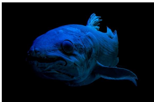
シーラカンスの標本（イメージ）

<生体> メキシコサラマンダー …「ウーパールーパー」という呼び名で有名になった両生類。