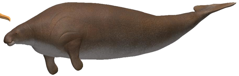
ステラーカイギュウ

(ペンギンそっくりに進化した、ウヤカツオドリの仲間である古代生物。※ただし、ペンギンの仲間だと考える説もある。)