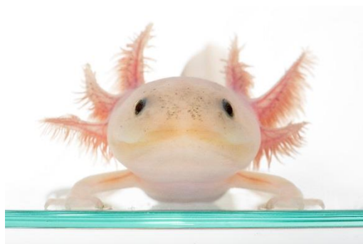
メキシコサラマンダー（ウーパールーパー）