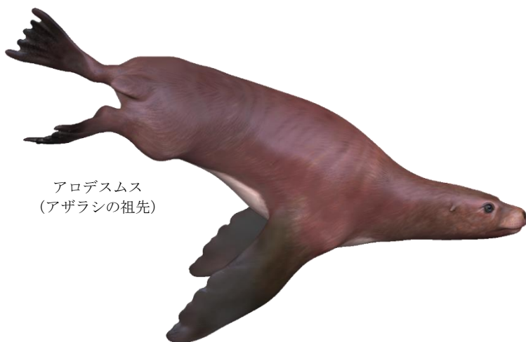
アロデスムス (アザラシの祖先)