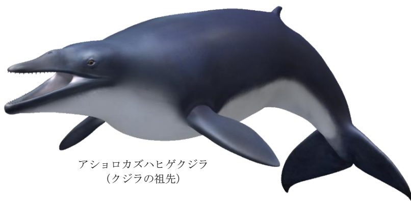
アショロカズハヒゲクジラ (クジラの祖先)