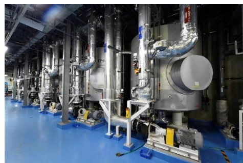
海遊館 2 階にあるろ過装置システム